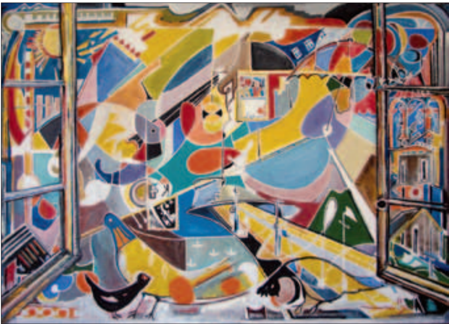
Իմ պարունակից, 2011թ., գուաչ, կրավ:

Իմ նկարները հիմնականում մասնավոր հավաքածուներում են: Անցել եմ խՍՀՄ մեծ ու փոքր քաղաքներով, Սվերդլովսկում, Նովոսիբիրսկում մեծ ցուցահանդես եմ բացել, նույնը Վլադիվոստոկում, այս վերջին ցուցա-