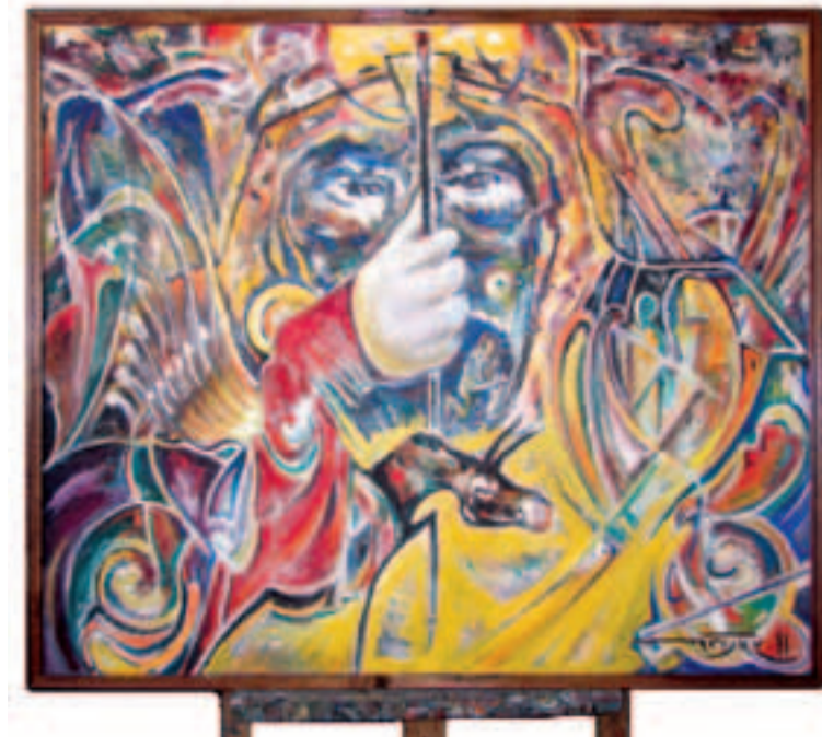
Ռոբերտ Կամոյան, ինքնանկար, յուղ, կրավ:

Հ.Գ. Նկարիչ Կամոյանը պատրաստ է Կապան քաղաքին նվիրել իր՝ 150 եւ ավելի թվով ստեղծագործությունը: