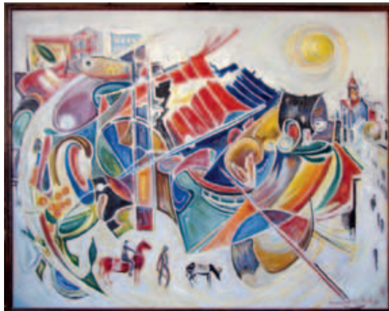
Վաչագան գյուղ, 2008թ., յուղ, կրավ: